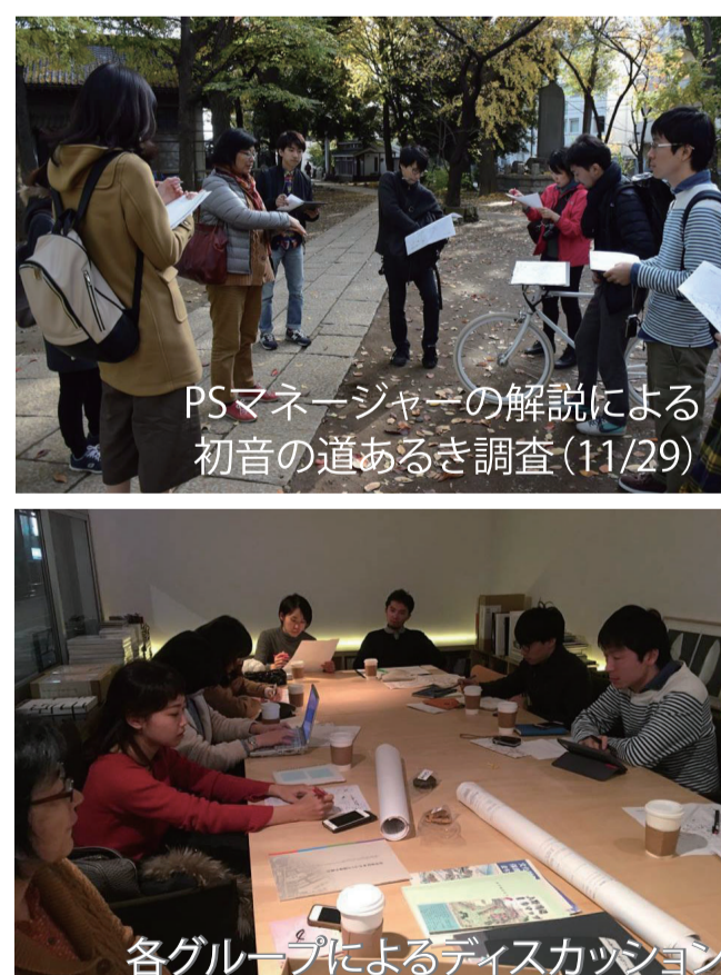
谷中地区まちづくり交流会で活動報告・提案 最終成果報告会・講評会(3/13)